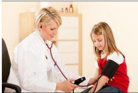
(혈압측정 그림, 어린이로)

뛰어다니거나, 화가 나거나, 게임을 할 때 혈압은 잠깐 높아질 수 있어요. 하지만 여러 번 재어도 계속 혈압이 높으면 고혈압일 수 있으니 의사선생님을 만나야 해요.